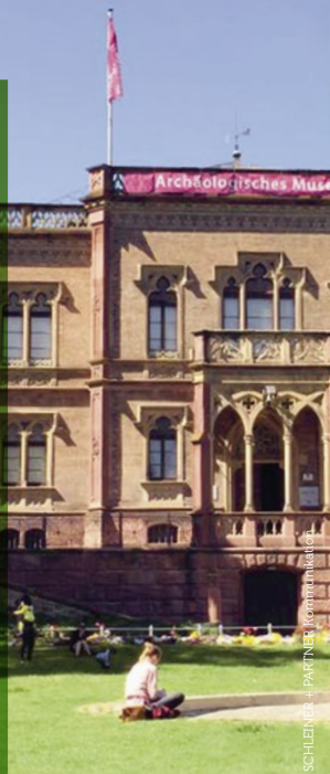
SCHLEINER + PARTNER Kommunikation

Der Lokalverein Innenstadt e.V. und die Begleitgruppe „Colombini“ bleiben dem Projekt allerdings weiterhin verbunden – und wollen mit „Ein Tag im Park“ gemeinsam mit dem Archäologischen Museum zeigen, auf welche spannende Weise der Park von Erwachsenen wie Kindern genutzt werden kann.